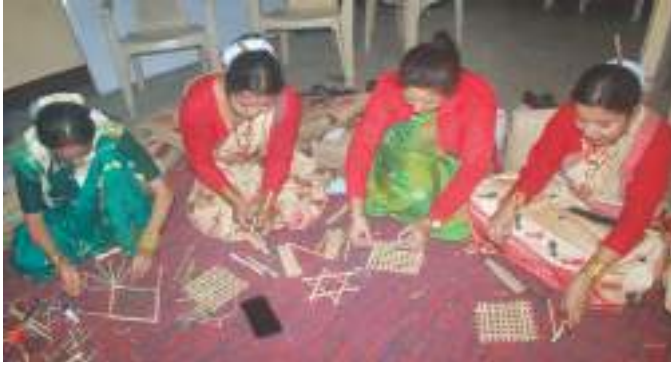
स्मृतियों और परंपराओं को गढ़ना - बांस शिल्प की कला में तल्लीन प्रतिभागियों द्वारा क्षेत्र की सांस्कृतिक समृद्धि को प्रतिबिंबित करती कृतियों का सृजन।

इस पाठ्यक्रम को विशेष रूप से पारंपरिक प्रचलन के दायरे में व्यावहारिक अनुभवों को शामिल करके सैद्धांतिक चर्चाओं से आगे बढ़ने के लिए डिजाइन किया गया है। विशिष्ट शिल्प कक्षाएं, जिनमें बांस शिल्प जैसी गतिविधियां शामिल हैं, प्रतिभागियों को उत्तर पूर्व संस्कृति और देश के बाकी हिस्सों में गहराई से निहित कलात्मक परंपराओं से जुड़ने के व्यावहारिक अवसर प्रदान करती हैं। बांस शिल्प, जो इस क्षेत्र में अपनी स्थिरता और सांस्कृतिक महत्व के लिए जाना जाता है, प्रतिभागियों के लिए अपने कौशल को निखारने का केंद्र बिंदु बन गया है। ये शिल्प कक्षाएं न केवल कौशल विकास के लिए एक मंच के रूप में काम करती हैं, बल्कि हमारे राष्ट्र की अमूल्य विरासत को संरक्षित और बढ़ावा देने के साधन के रूप में भी काम करती हैं। ऐसे व्यावहारिक तत्वों के एकीकरण ने सीखने के अनुभव को और समृद्ध किया है, जो एक सर्वांगीण और कौशल-उन्मुख शिक्षा को बढ़ावा देने के लिए एनईपी-2020 के व्यापक उद्देश्यों के अनुरूप है। 482वां अनुस्थान पाठ्यक्रम क्षेत्रीय केंद्र, गुवाहाटी की प्रतिबद्धता का एक प्रमाण है जो सांस्कृतिक रूप से जागरूक और समावेशी शैक्षिक वातावरण तैयार करता है।