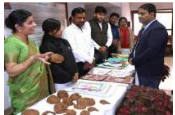
कार्यशाला के दौरान तैयार किए गए शिल्प कार्य को प्रस्तुत करते हुए प्रतिभागी