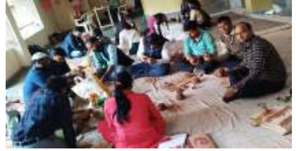
चेरियल मास्क की कला सीखते प्रतिभागी

जैसे-जैसे प्रतिभागियों ने कठपुतली के विभिन्न आयामों का पता लगाया, कार्यशाला सैद्धांतिक समझ से आगे व्यावहारिक सत्रों तक बढ़ी। शिक्षकों ने न केवल कठपुतली कला सीखी, बल्कि रचनात्मक और प्रासंगिक रूप से महत्वपूर्ण शिक्षण सामग्री के विकास के लिए एनईपी-2020 के साथ तालमेल बिठाते हुए सक्रिय रूप से अपनी कठपुतली-आधारित शिक्षण सामग्री भी बनाई। इस गहन अनुभव ने शिक्षकों को अपनी कक्षाओं को कठपुतली के मंत्रमुग्ध जादू से भरने, एक गतिशील और पारस्परिक चर्चा वाले शैक्षिक वातावरण को बढ़ावा देने के लिए सशक्त बनाया।