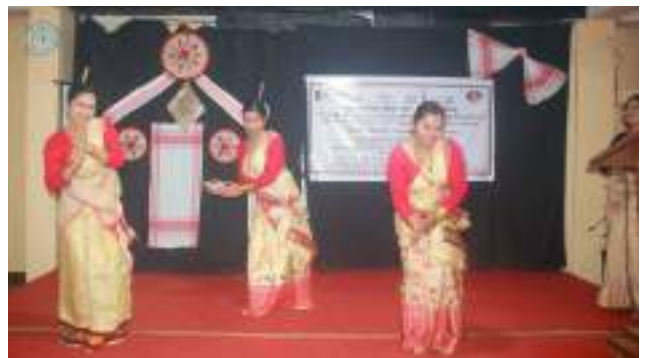
असम के लोक नृत्य - बिहू का प्रदर्शन