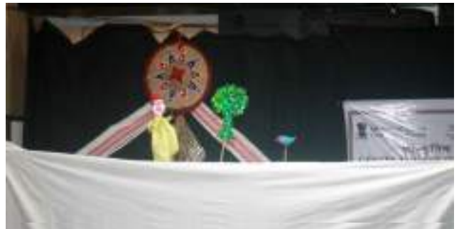
छड़ी कठपुतली के माध्यम से खेल का प्रदर्शन करते प्रतिभागी