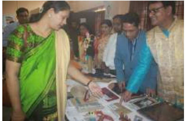
प्रतिभागी कार्यक्रम के दौरान तैयार की गई अपनी शिक्षण अधिगम सामग्री प्रस्तुत करते हुए

सीसीआरटी, नई दिल्ली ने ‘सेवारत शिक्षकों के लिए स्कूली शिक्षा में शिल्प कौशल को एकीकृत करने’ पर केंद्रित एक परिवर्तनकारी कार्यशाला की मेजबानी की। उन्हें