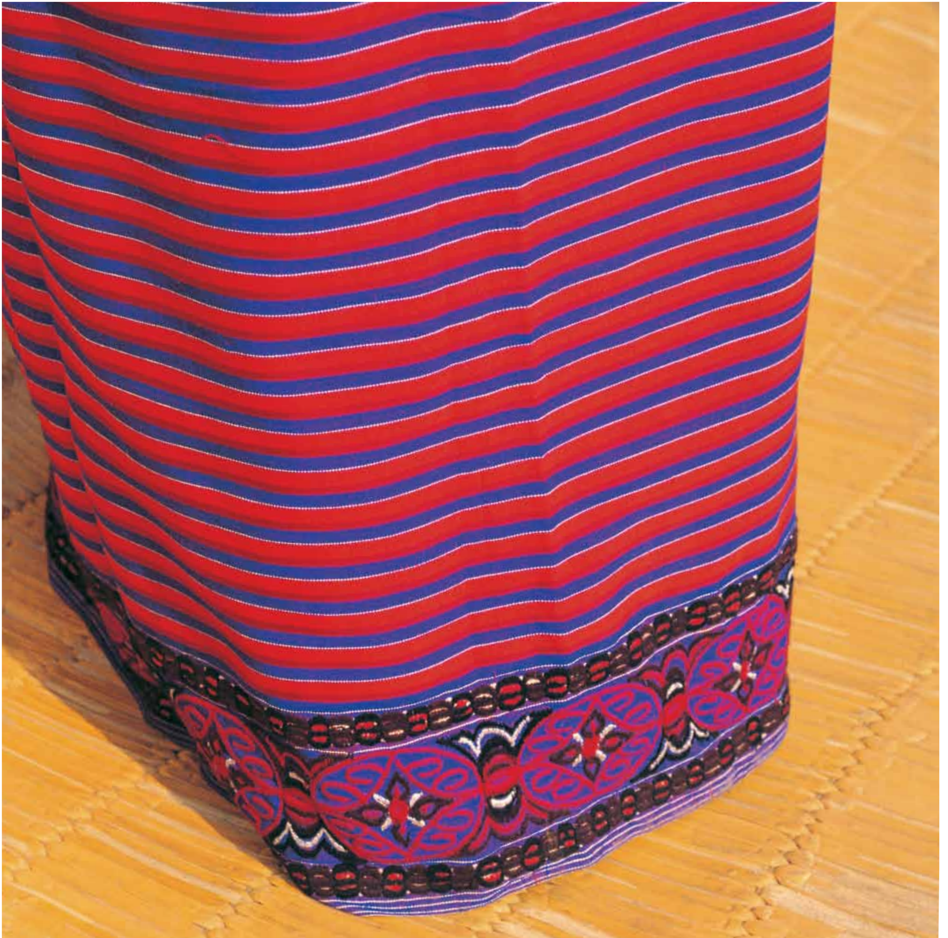
8. Embroidered Border, Phanek, Manipur