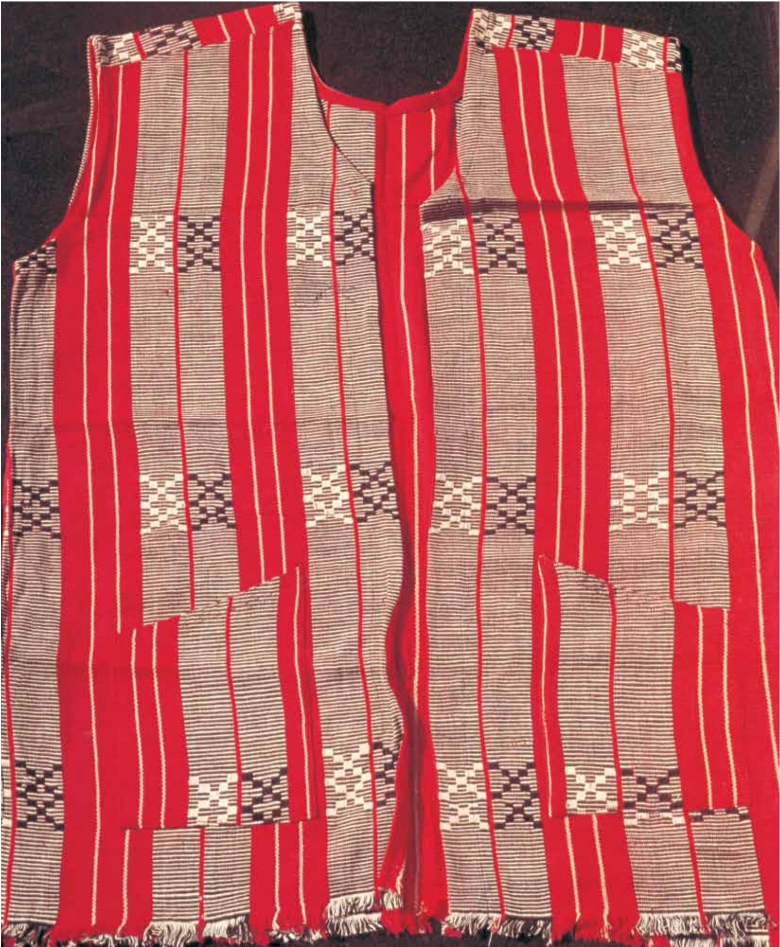
7. Chhapra, Jacket, Tripura