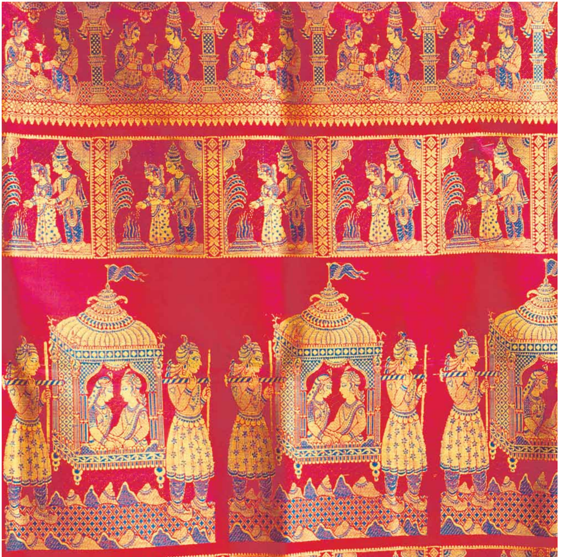
10. Baluchari Silk Saree, West Bengal