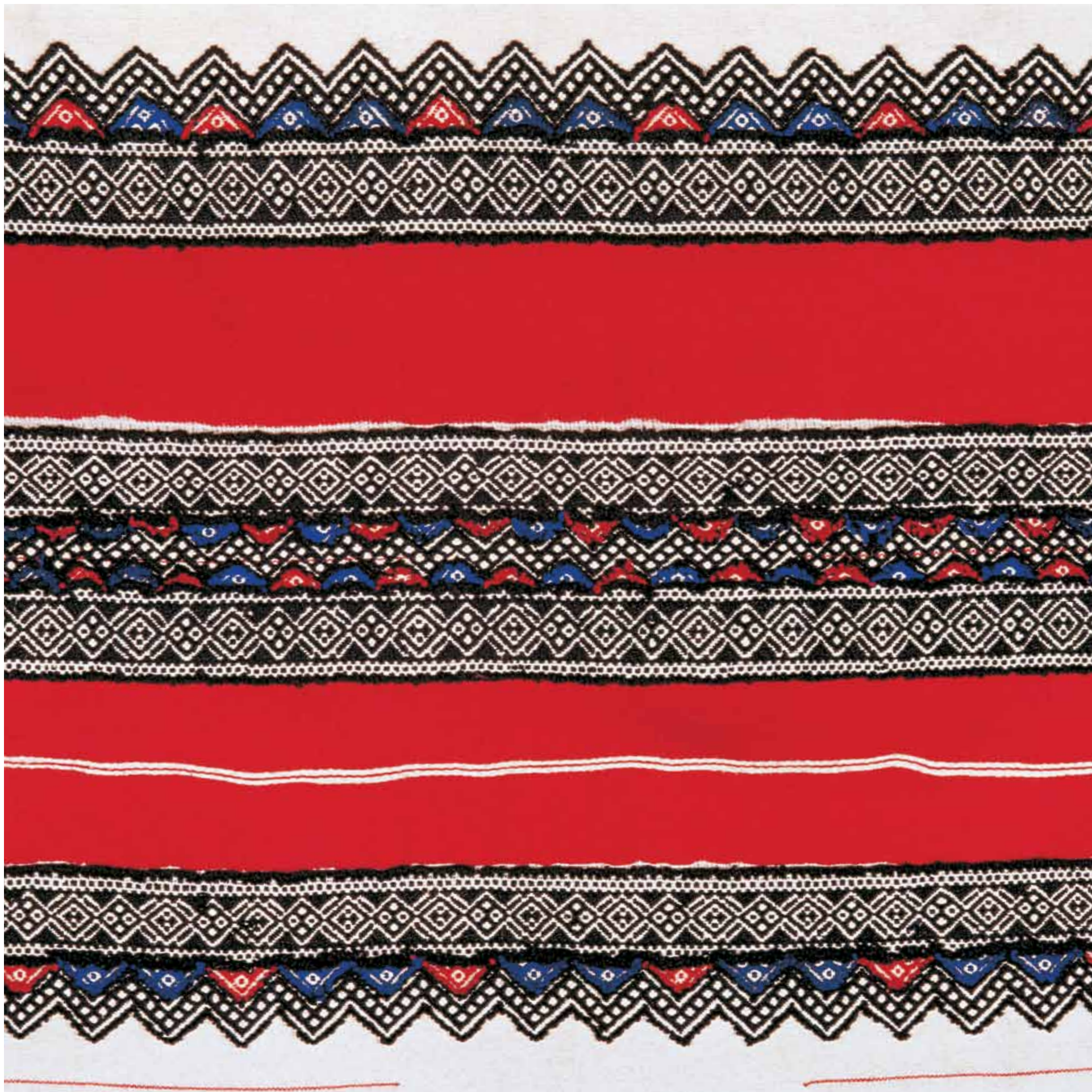
4. Toda Embroidery, Tamil Nadu