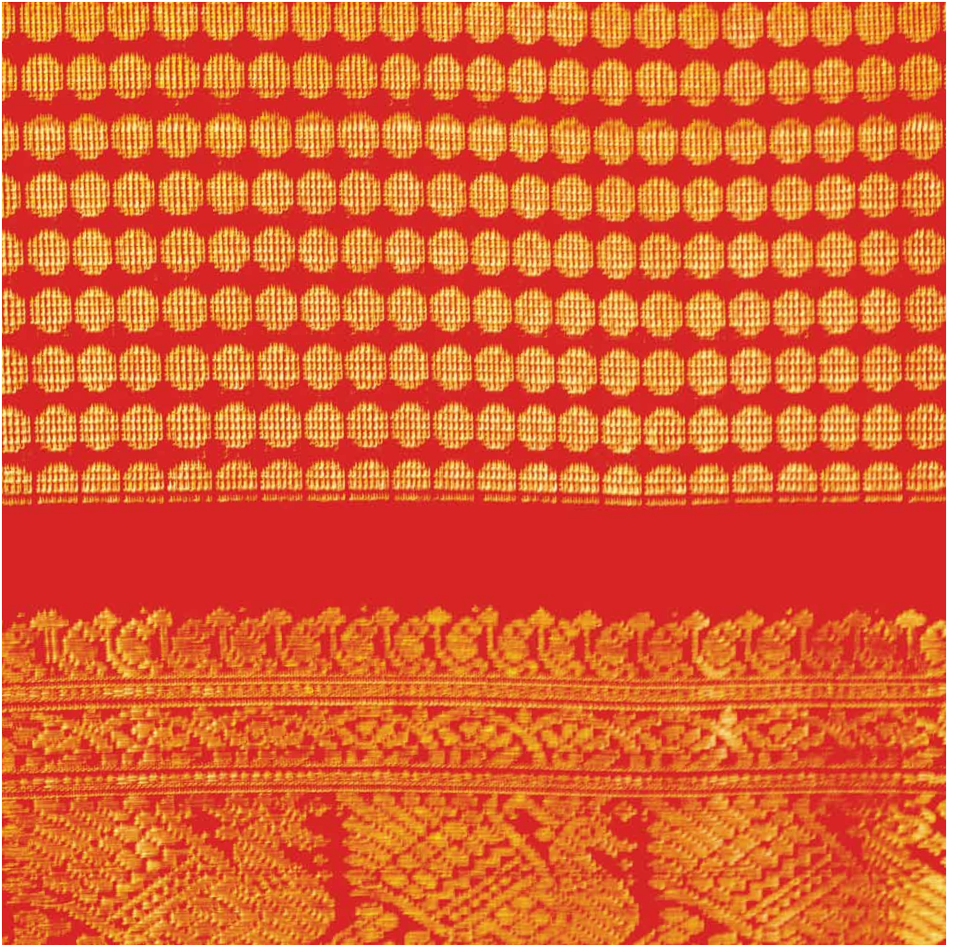
3. Kanchipuram Silk Saree, Tamil Nadu