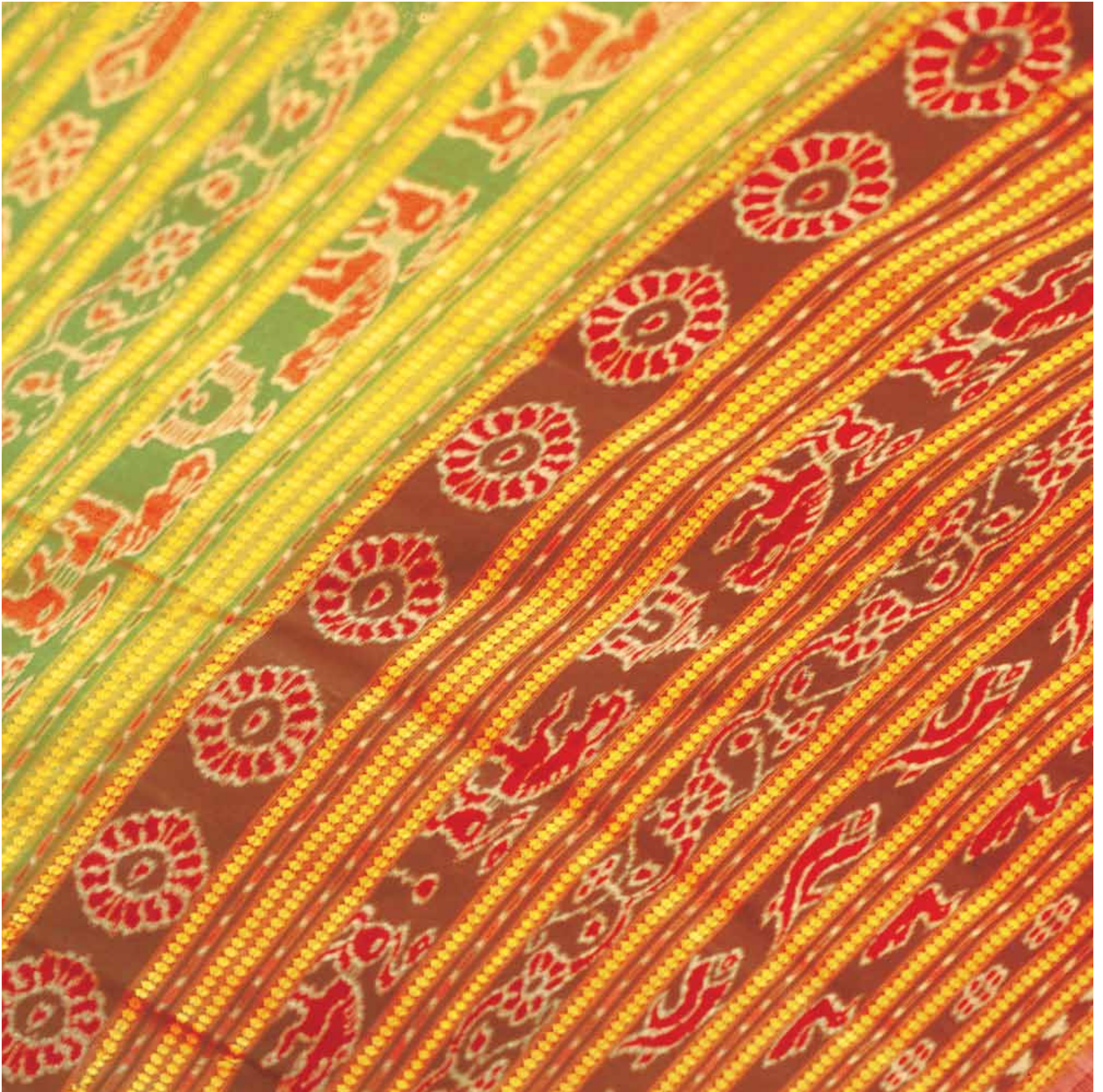
11. Ikat Silk Saree, Odisha