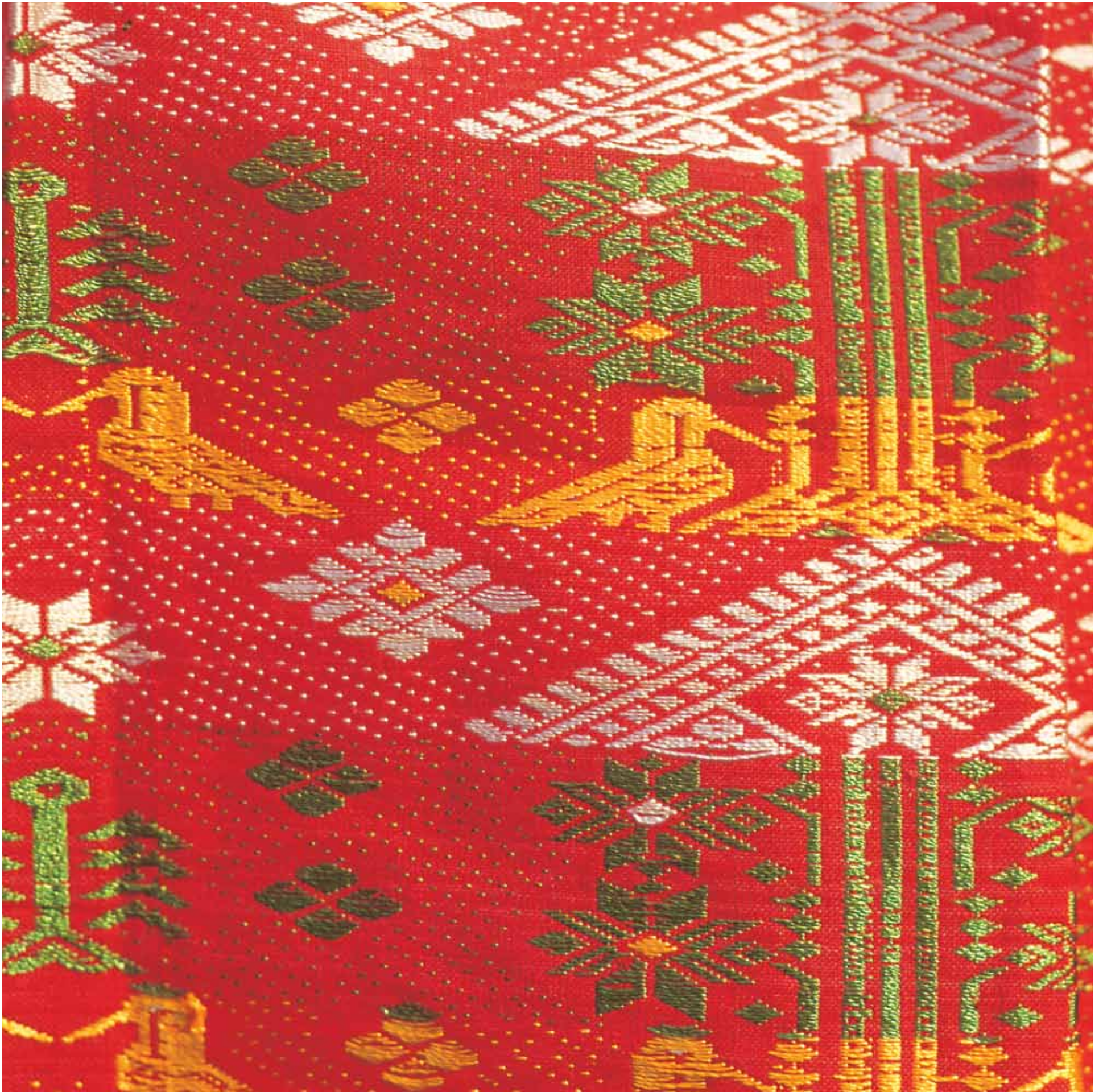
5. Mekhala, Assam