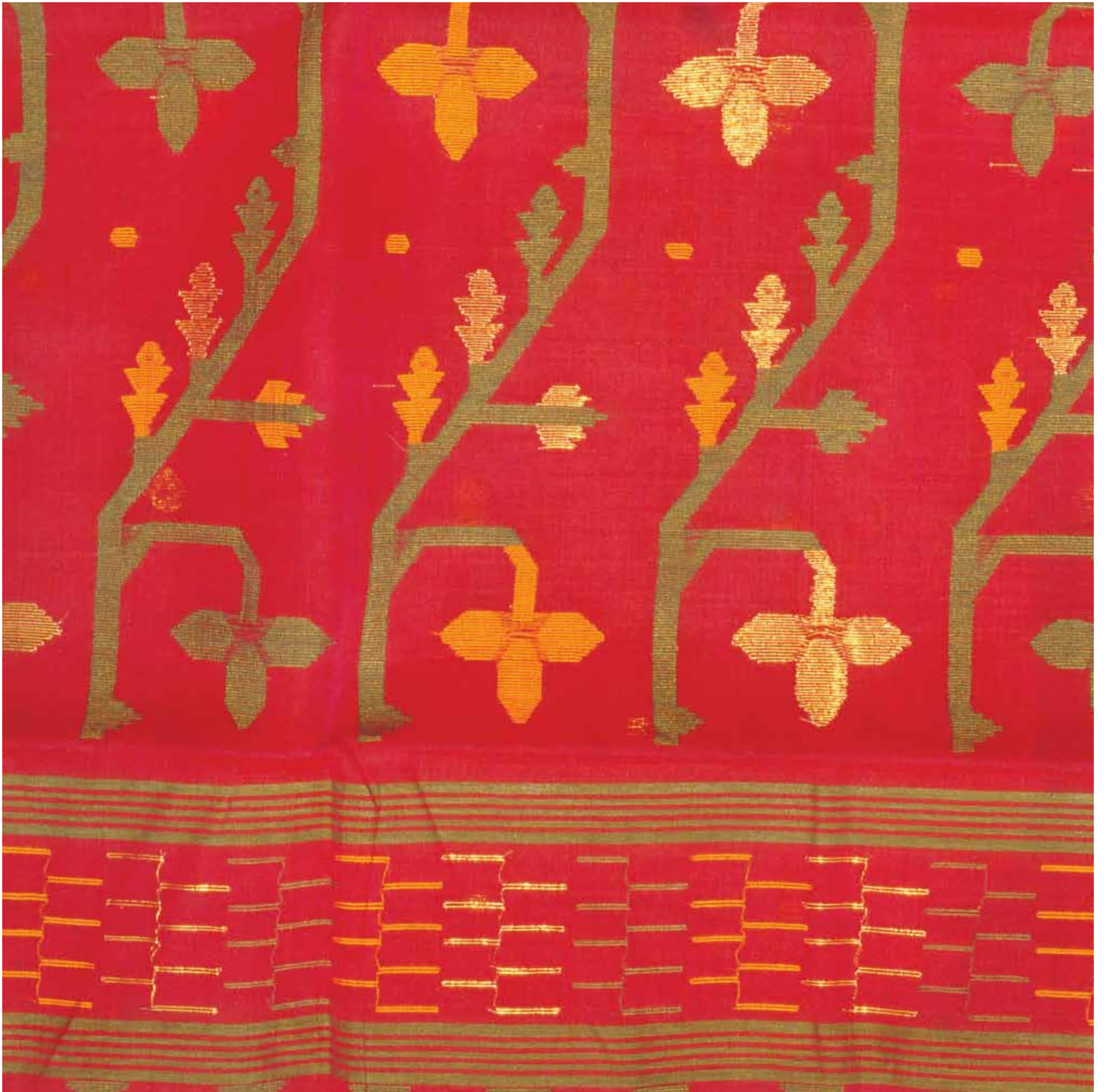
9. Embroidered Dhacca Silk Saree, West Bengal