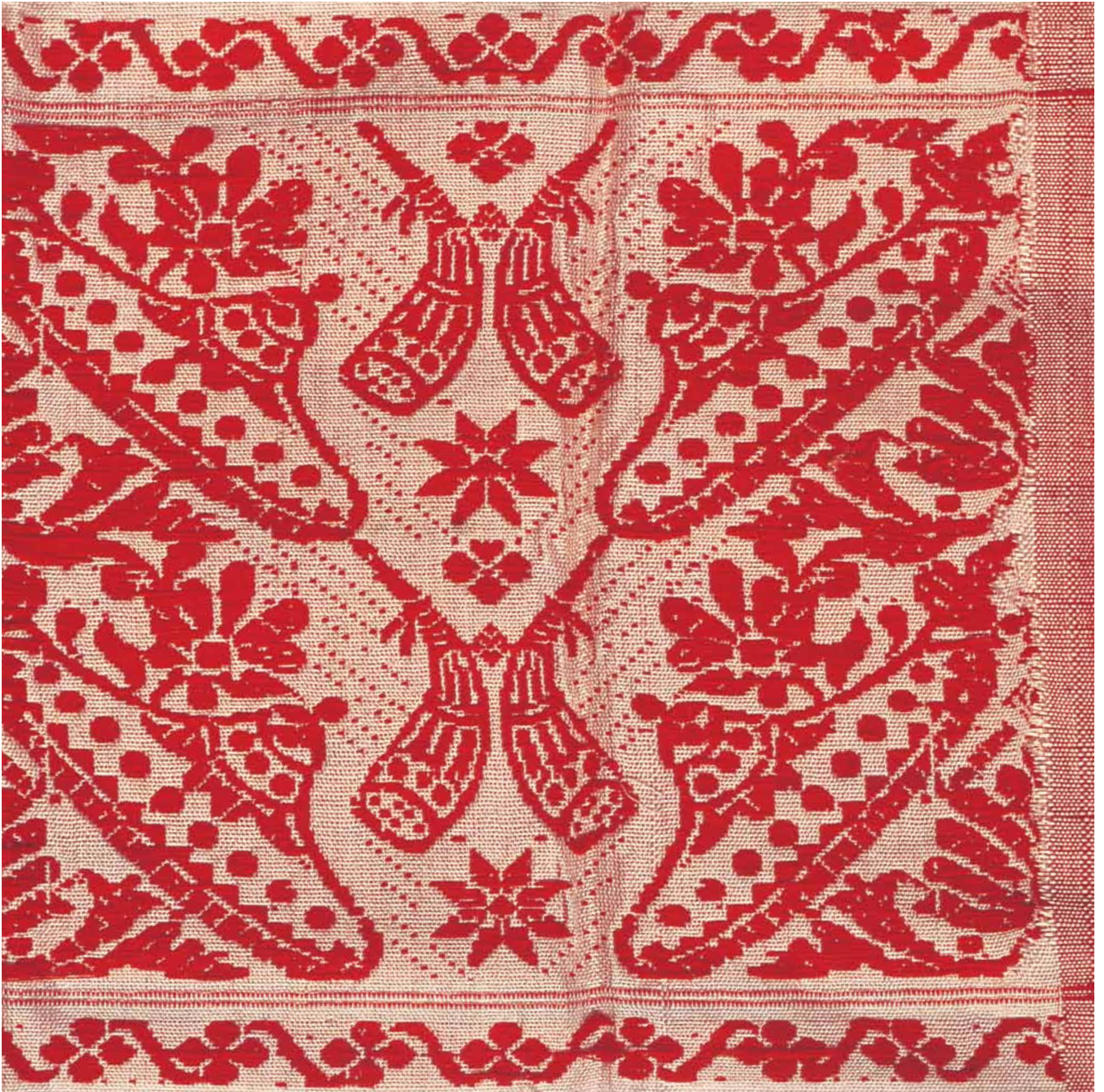
6. Jhapi Design, Gamucha, Assam