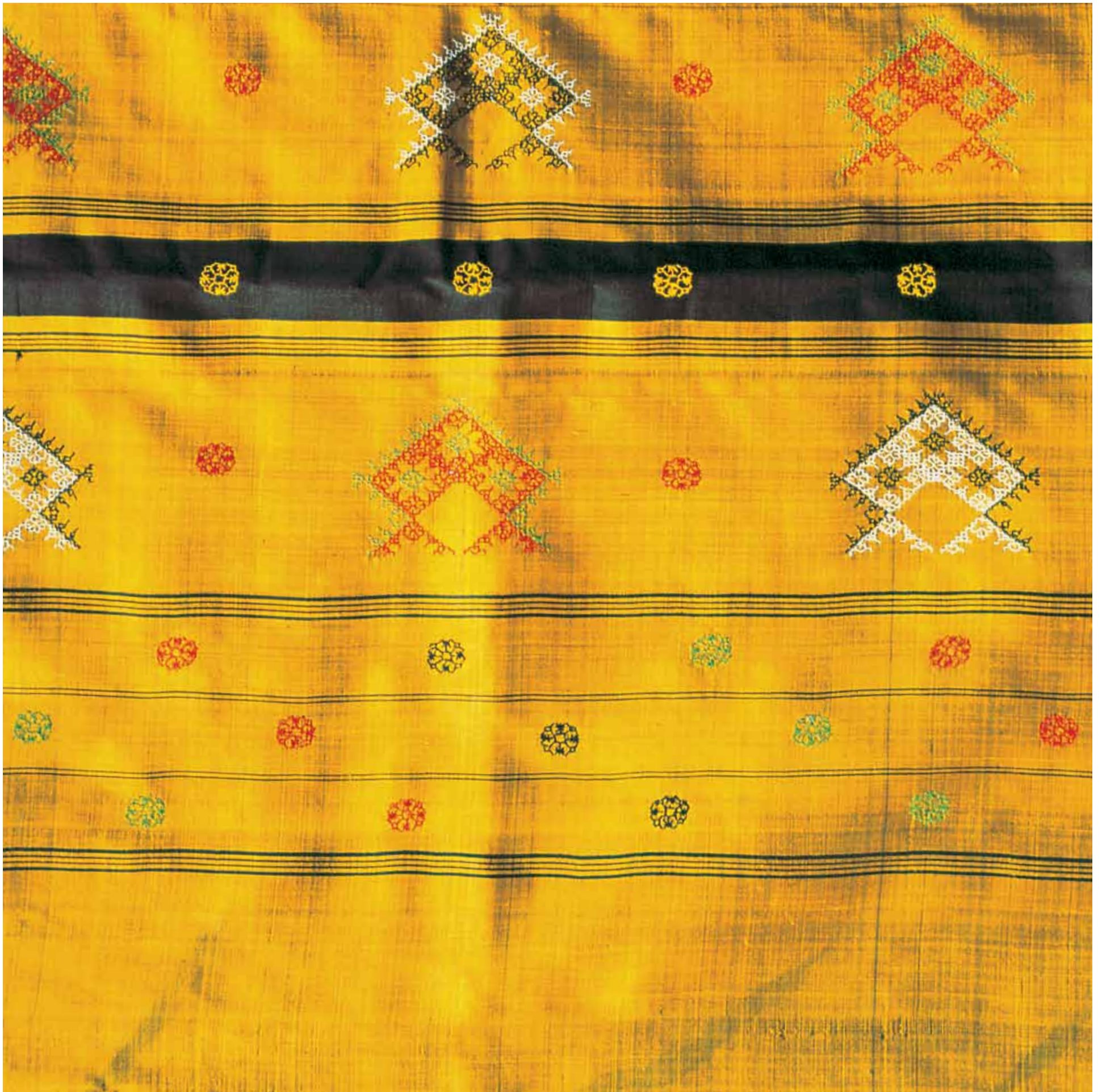
2. Embroidered Kasuti Silk Saree, Karnataka