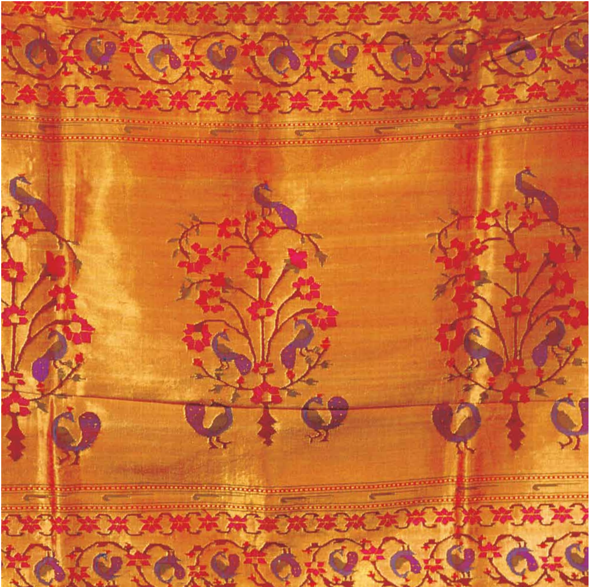
12. Paithani Silk Saree, Maharashtra