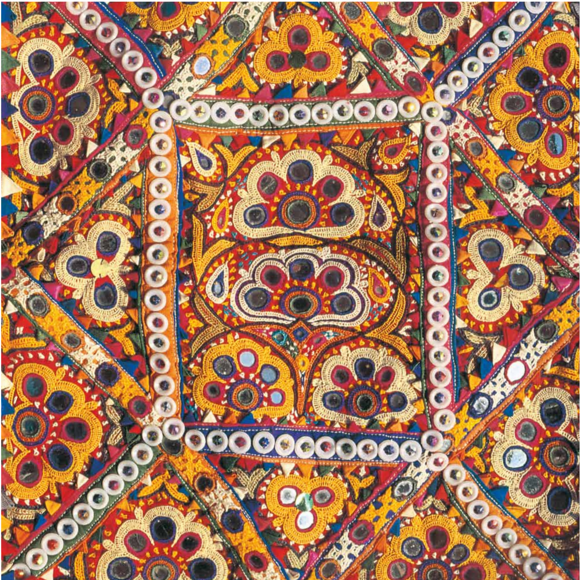
11. Mirror Embroidery, Gujarat