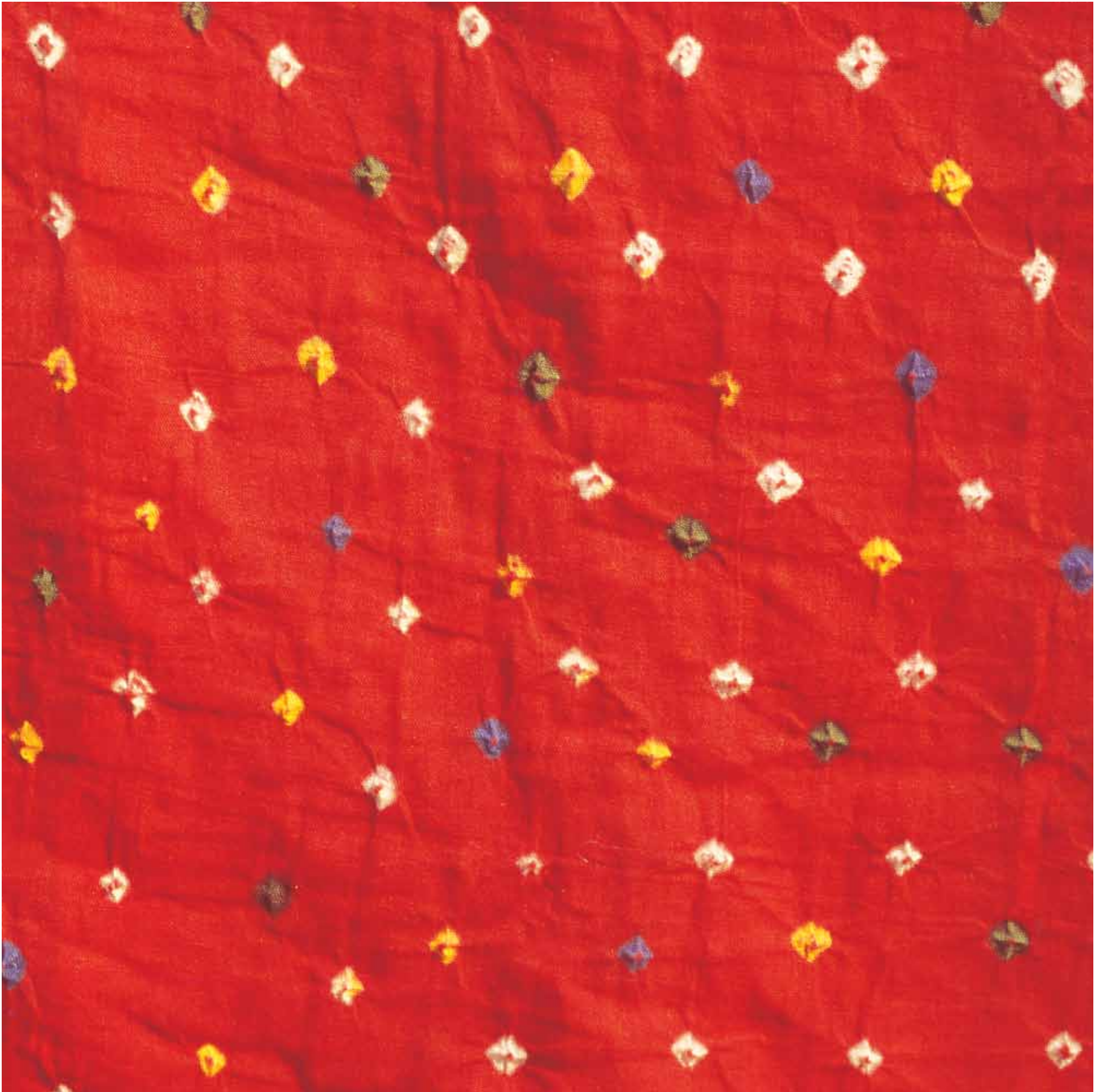
9. Bandhani Printing, Rajasthan