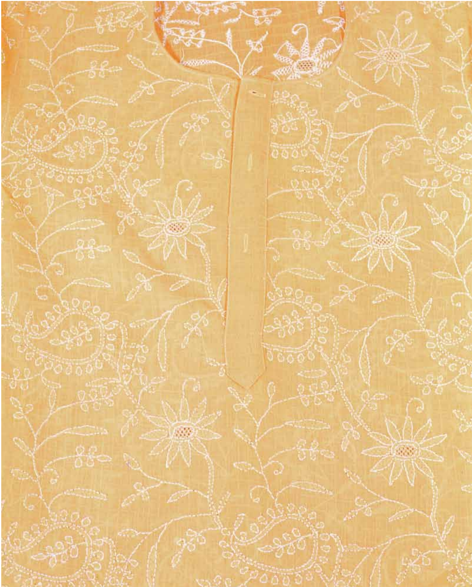
7. Chikan Embroidery, Kurta, Uttar Pradesh