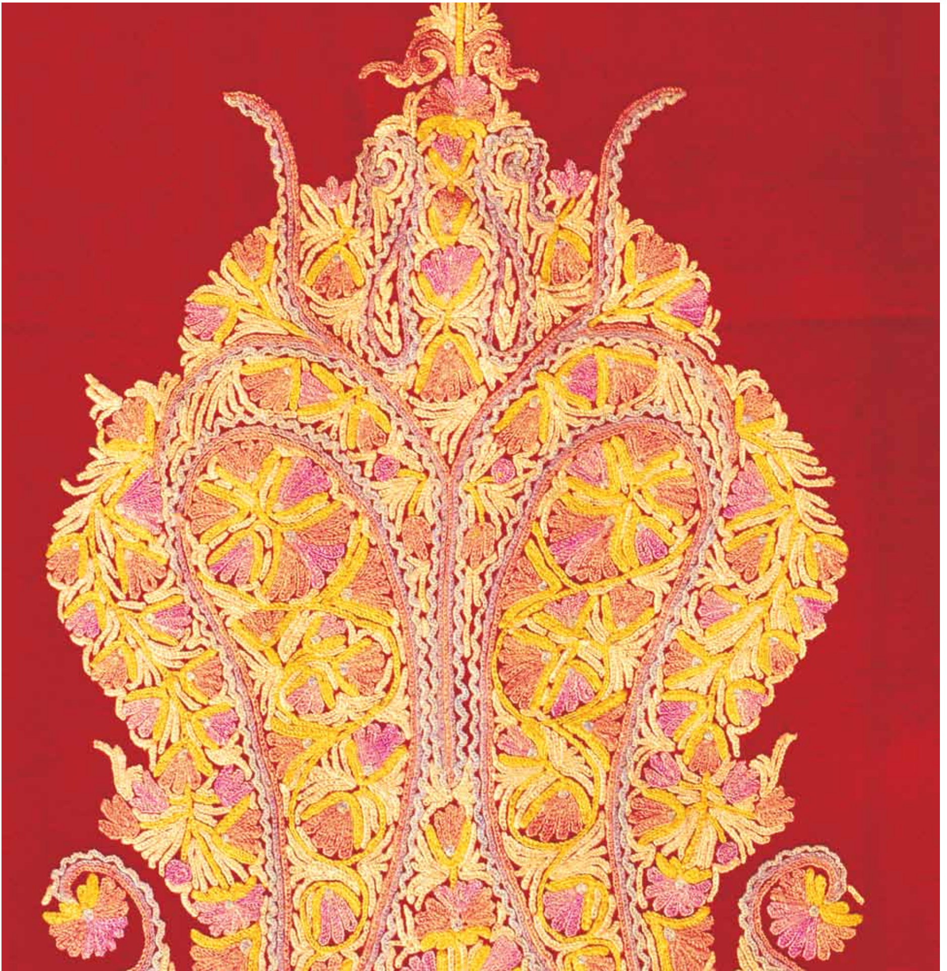
1. Crewel Work, Kashmir