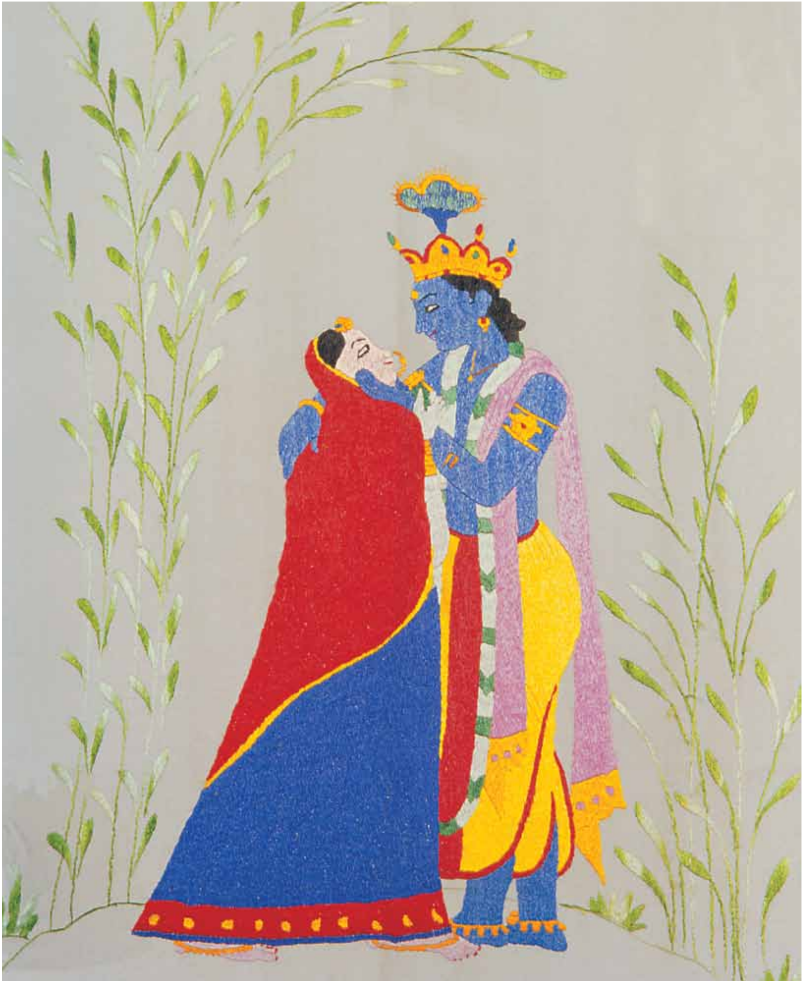
4. Embroidered Chamba Rumal, Himachal Pradesh