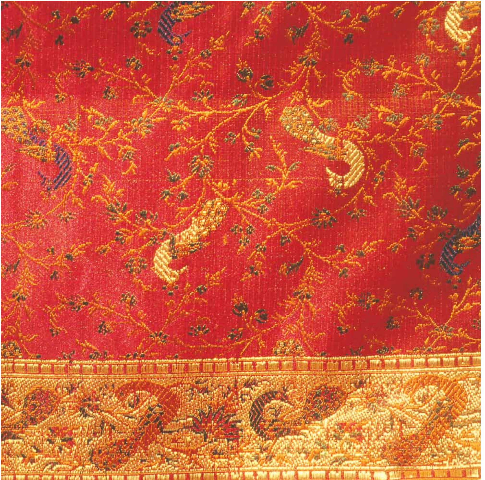
6. Banarasi Zari Saree, Uttar Pradesh