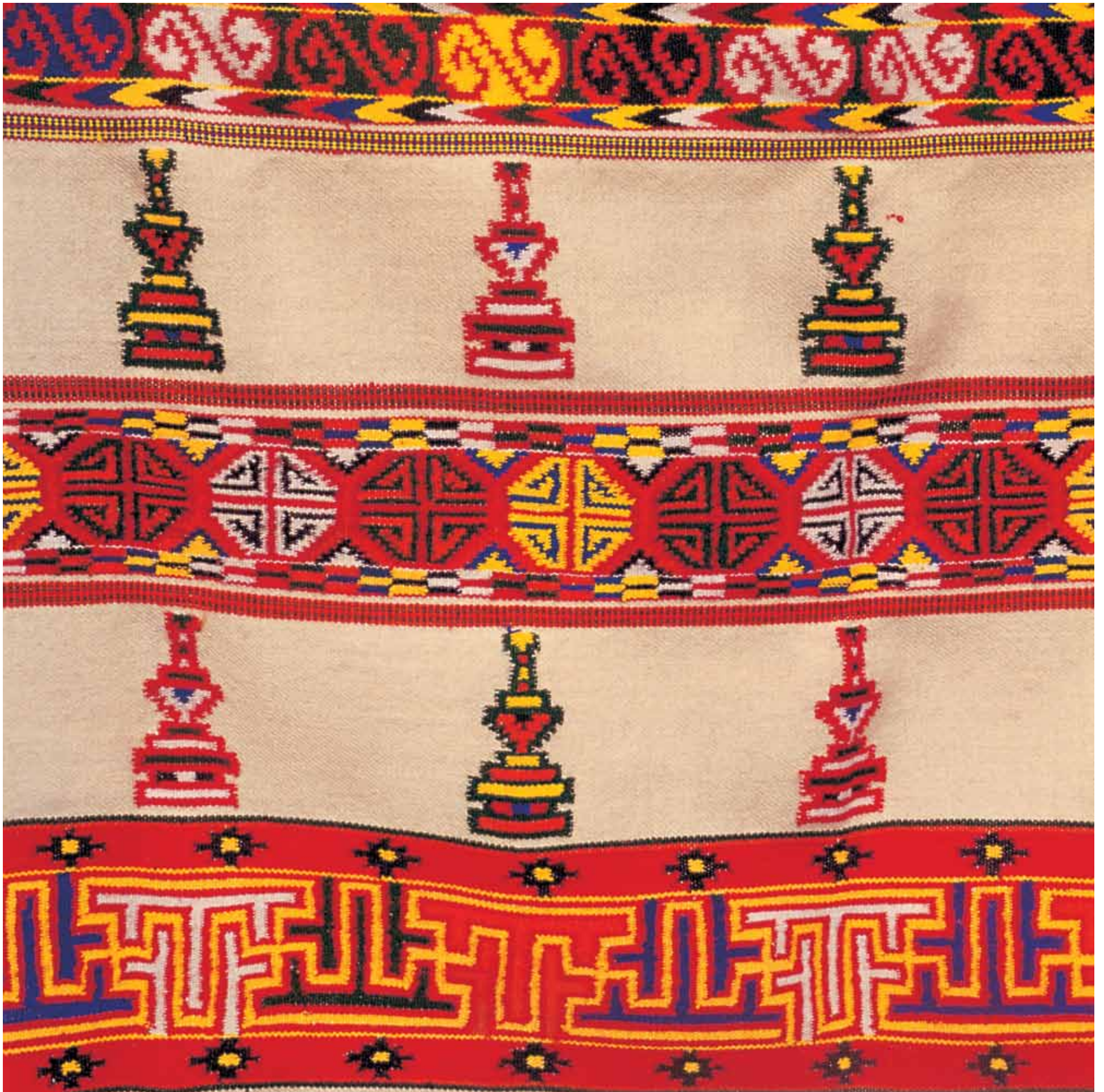
3. Kinnaur Shawl, Himachal Pradesh