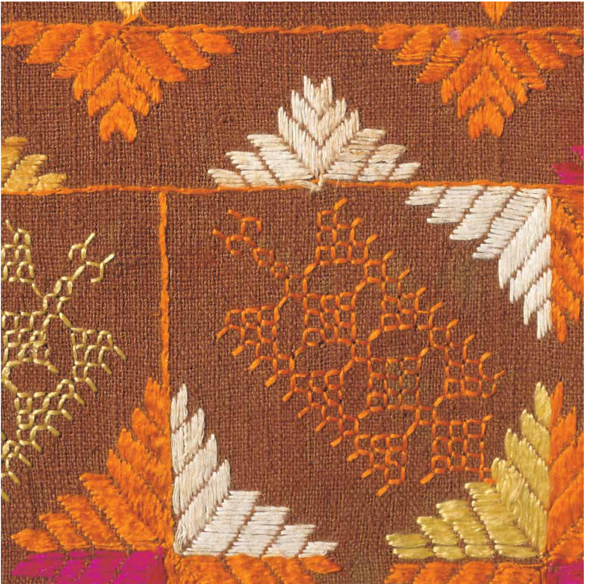
5. Bagh Phulkari, Punjab