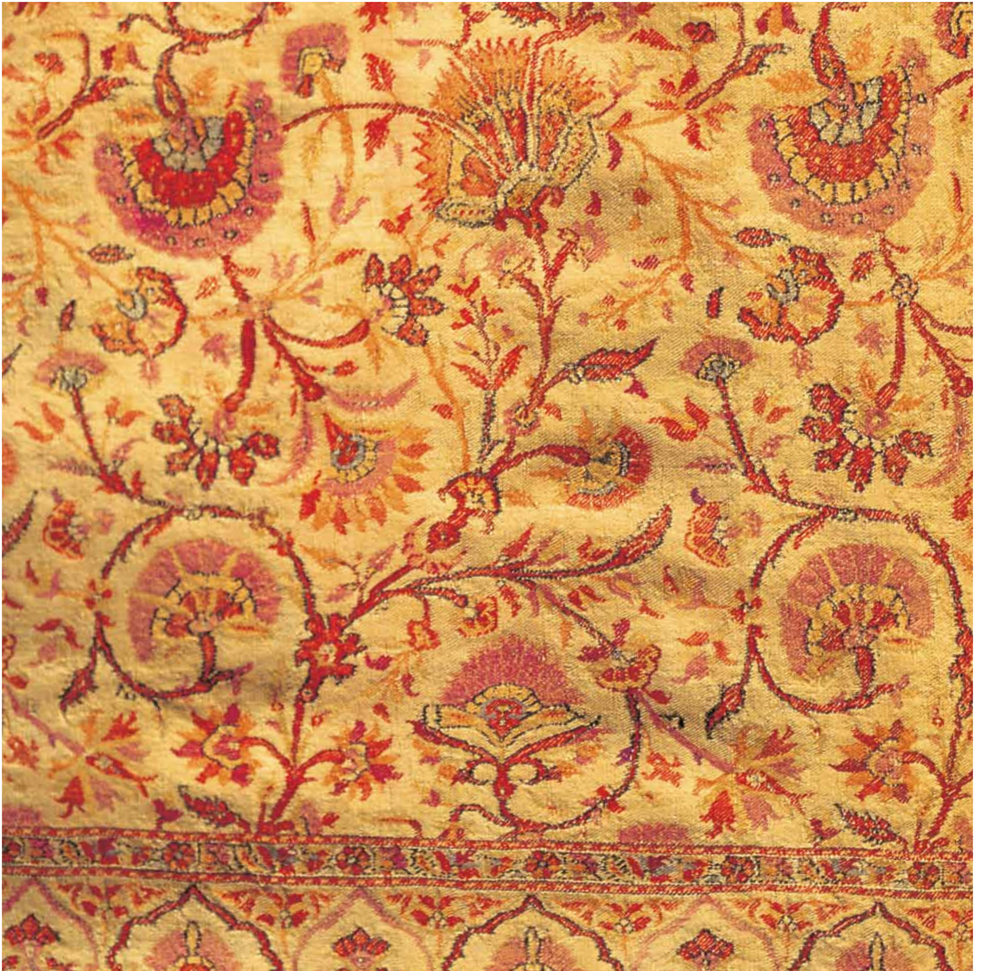
2. Embroidered Dorukha Shawl, Kashmir