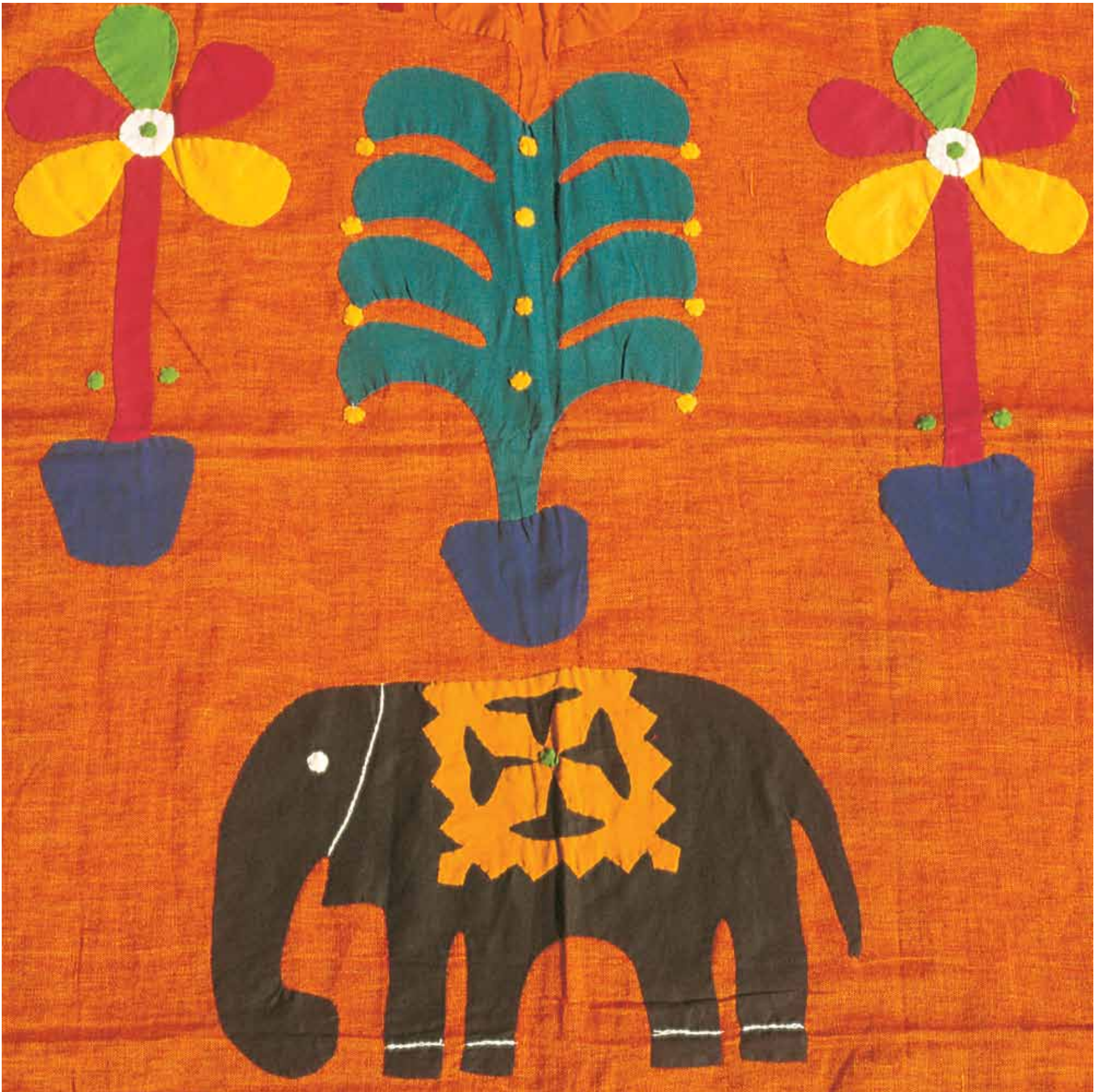
10. Applique Work, Gujarat